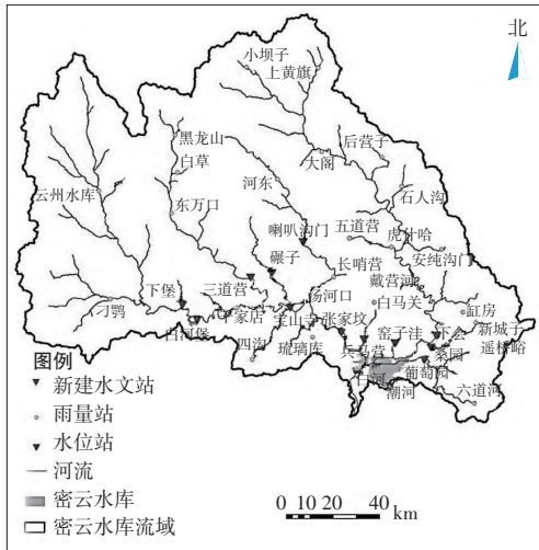
图1 密云水库流域示意图

站,1座调节池。水库建成之初,主要进行年调节,若逢连续枯水年,常在中低水位运行。20世纪80年代以来,水库基本不向农业供水,也不向天津、河北供水。尽量减少下泄量并将来水存在水库中作多年调节。密云水库流域及水文站、雨量站分布示意图见图1。